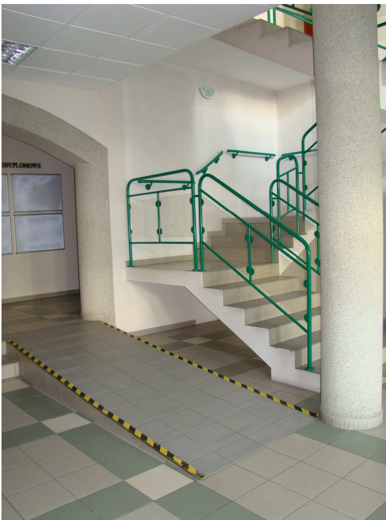
Podjazdy dla osób niepełnosprawnych w budynku A