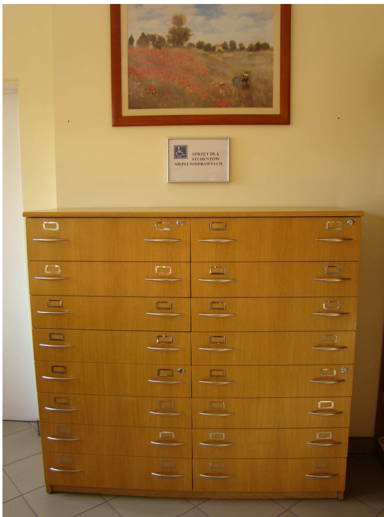
Wypożyczalnia sprzętu specjalistycznego dla studentów niepełnosprawnych