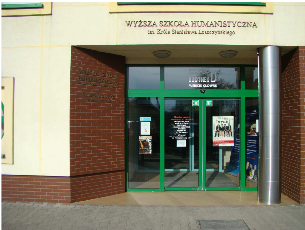
Wejście do budynku D (budynek główny Uczelni) – wejście od ul. Królowej Jadwigi

Swobodny dostęp do Uczelni zapewniają automatyczne drzwi.