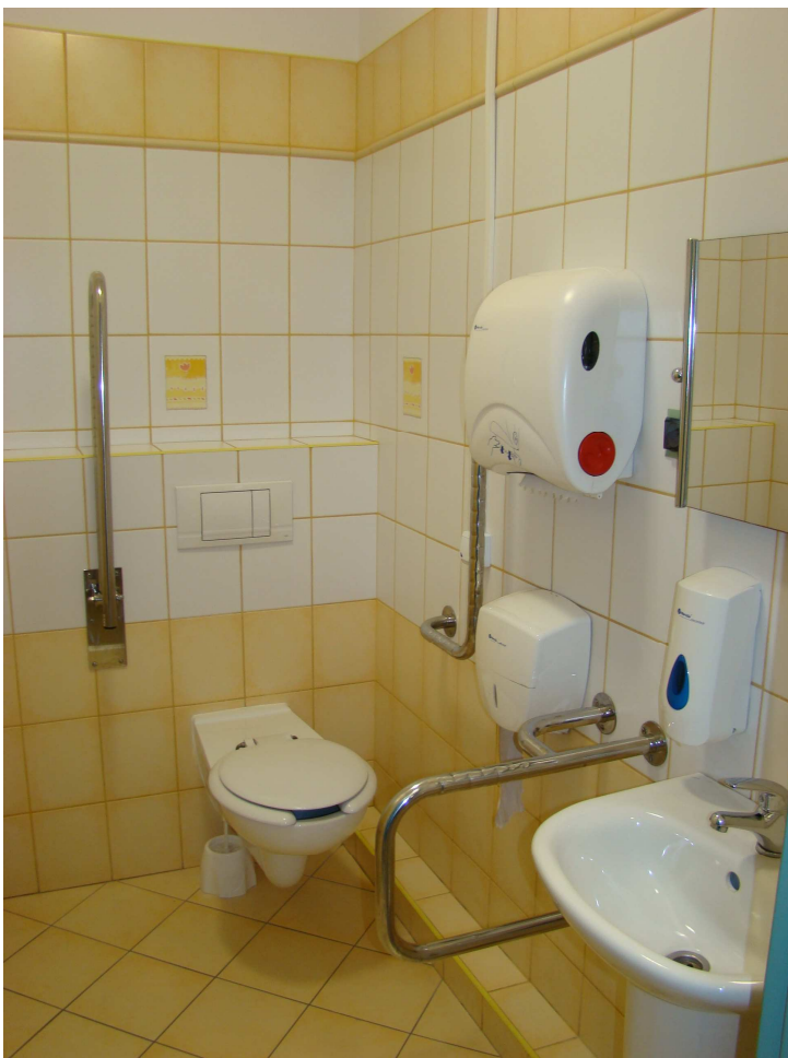
Toaleta dla osób niepełnosprawnych na parterze w budynku głównym