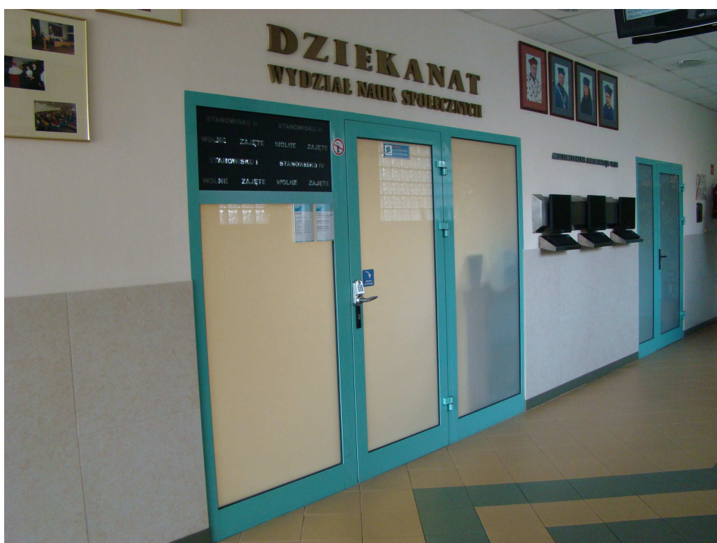
Dziekanat Wydziału Nauk Społecznych