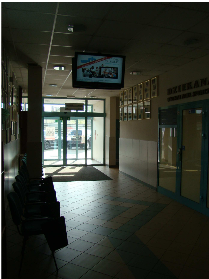
Szeroki korytarz przy Dziekanacie