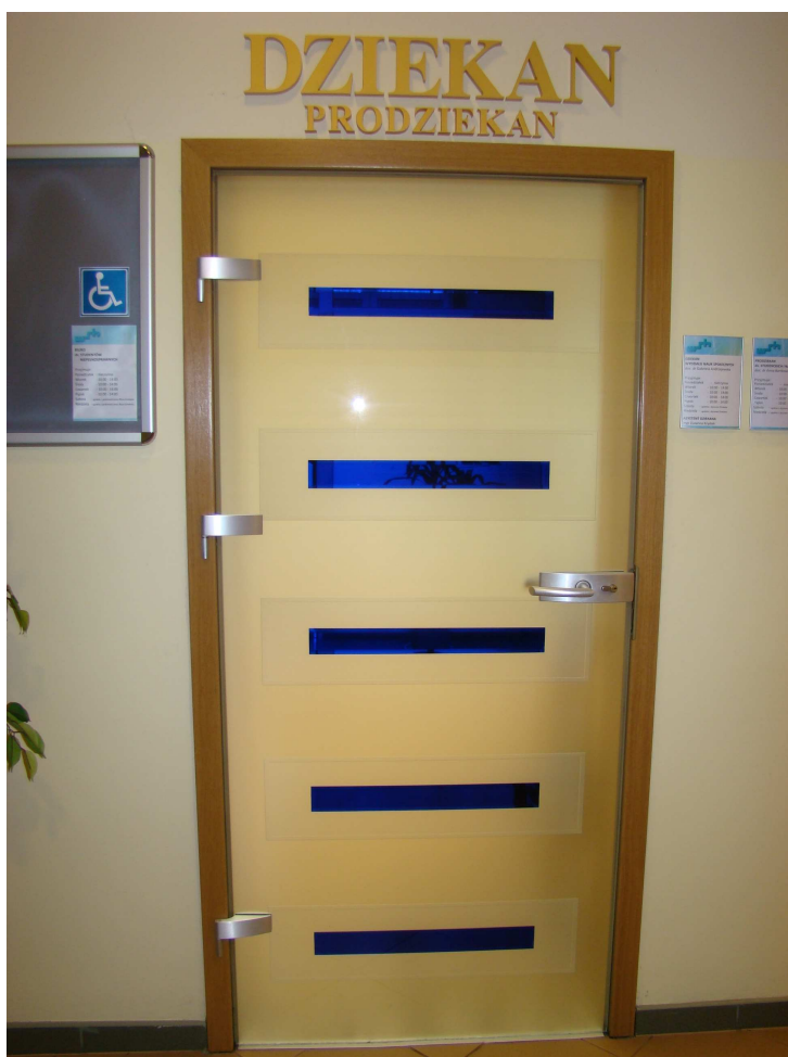
Biuro ds. Studentów Niepełnosprawnych

Ważnym atutem Uczelni jest dogodna lokalizacja Biura ds. Studentów Niepełnosprawnych oraz Dziekanatu, które znajdują się na parterze budynku głównego Uczelni.