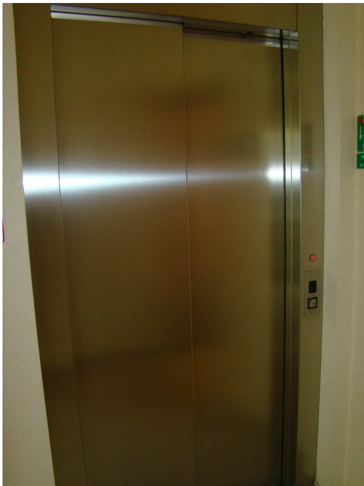
Winda w budynku Auditorium Maximum