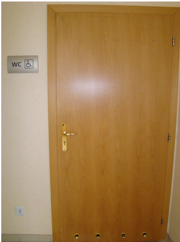
Toaleta dla osób niepełnosprawnych w budynku E (budynek Auditorium Maximum)