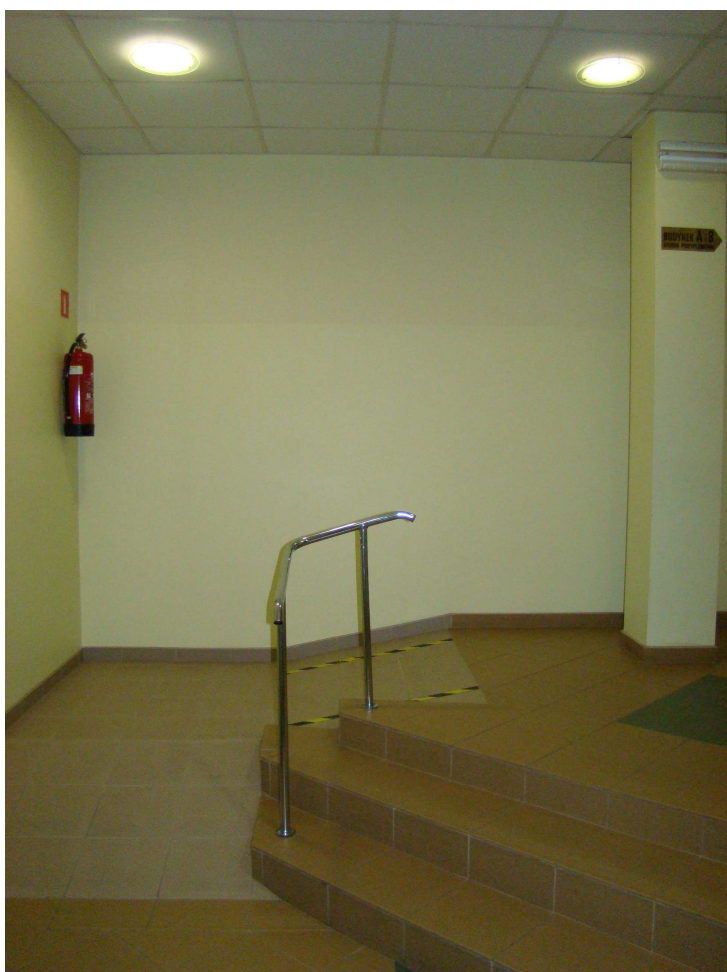
Podjazdy dla niepełnosprawnych pomiędzy budynkami A i D