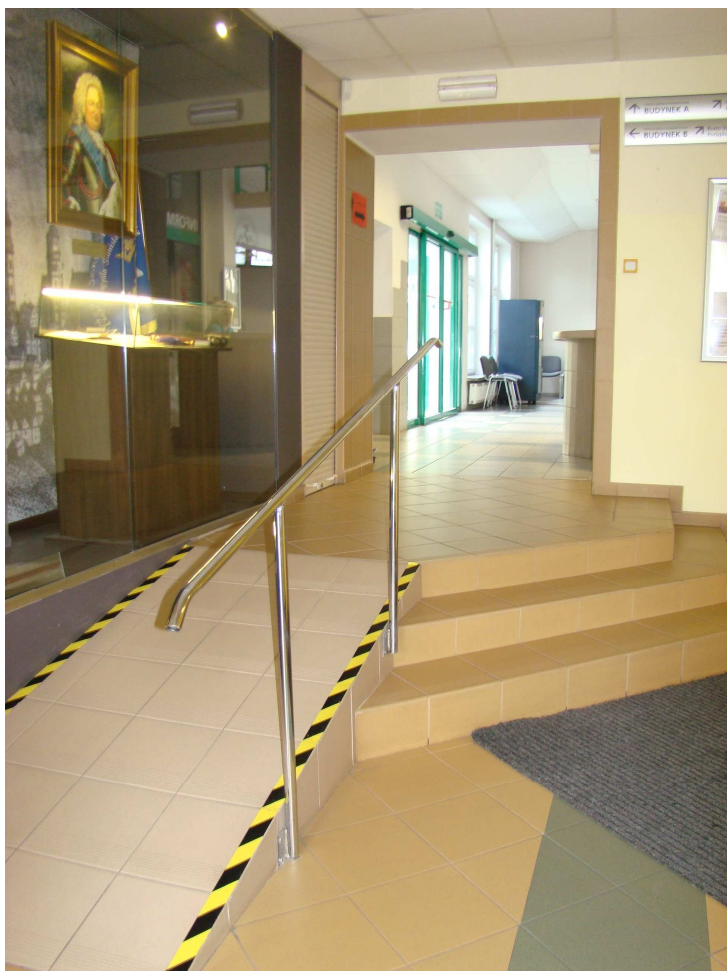
Podjazdy dla osób niepełnosprawnych w budynku D